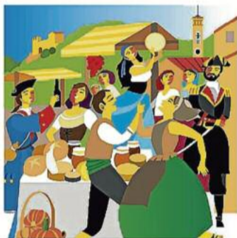
1. La gent d'aquesta contrada, de Castellbell i el Vilar, fem cada any una festassa, "Resistents", que fa parlar.