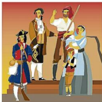
2. Hi enaltim uns personatges que varen entrar en combat en defensa de la terra i la nostra llibertat.